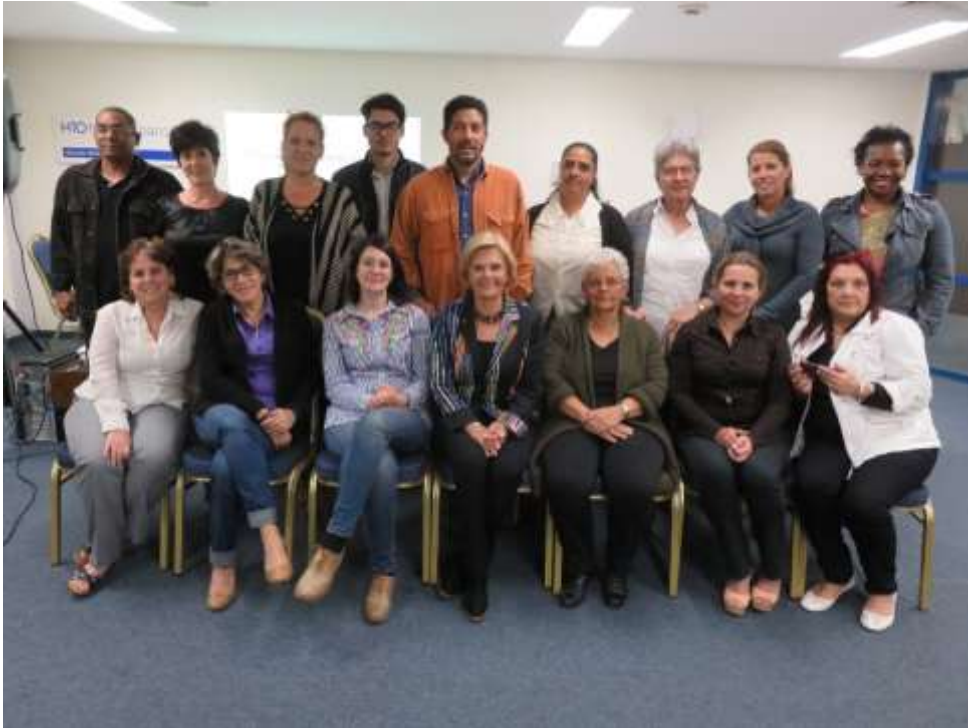
Sesiones de trabajo grupal y participantes en el Segundo Taller Temático Alineación de la Vivienda en Cuba con la NAU, enero 2018