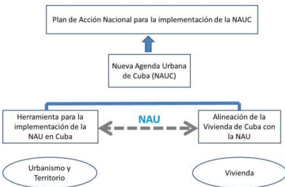
Figura 1. Relación del documento de alineación del sector vivienda en Cuba con la NAU y el PAN

Los talleres temáticos sobre la vivienda, mencionados al principio de este documento, tuvieron entre sus objetivos, proponer acciones como posibles soluciones o mitigación de los problemas existentes. La metodología seguida a través de ejercicios participativos, consistió en la conformación de “matrices” que vinculan y cruzan los pilares de la NAU con áreas fundamentales del desarrollo de la vivienda en Cuba. Este documento de resultados constituye un insumo para el Plan de Acción Nacional y la implementación de la NAU en Cuba (Figura 1).