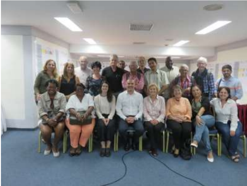
Sesiones de trabajo grupal y participantes en el Primer Taller Temático Alineación de la Vivienda en Cuba con la NAU, noviembre 2017.✚